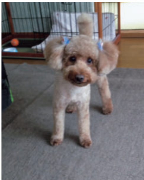
一時期カーペットを使用。 処分してクッションフロアに。