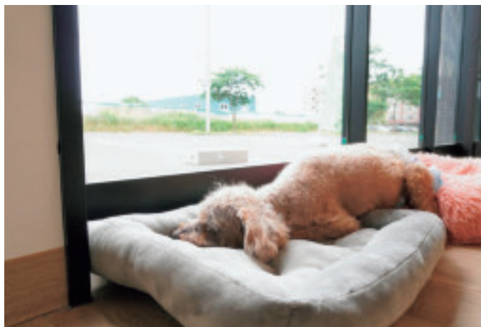
お気に入りの場所でお昼寝中のウーニー（老齢期）。 床と壁の一部に簡単に取り外しができ、 犬の歩行に優しいクッションフロアを採用。