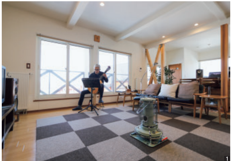
内外装リフォームの中古住宅を購入し、さらに断熱改修。開口部を大きくとったLDK(2階)から海と山を一望。耐震対策として数カ所に設けた筋交いが、空間のポイントにも。暖房はセントラルヒーティングで、お気に入りの石油ストーブをインテリアとして活用。

情報収集で注意すべきことは。 白井 住宅情報誌やウェブサイトをこまめにチェックして、「こうしたい」「こんな風に暮らしたい」といったご自分の理想に沿う施工事例をたくさん見るとよいでしょう。そ