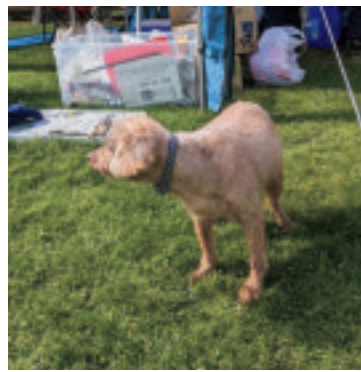
キャンプに出掛けたときのウーニー。

高齢犬になると、お漏らし、嘔吐等が多くなります。そこで我が家では、住宅の床（フローリング）の上にクッションフロアを敷いています。