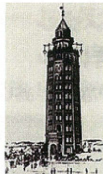
凌雲閣（りょううんかく）

日本エレベーター協会では、この11月10日を「エレベーターの日」と定め、 昇降機の安全・安心な利用のためのキャンペーンを実施しています。