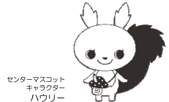
センターマスコット キャラクター ハウリー

※FAXでのお申し込みの場合は、下記情報をご記入の上、切り取らずそのまま送信して下さい