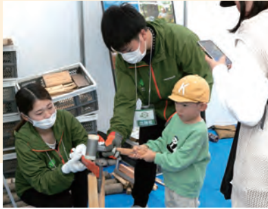
※写真は昨年イベントの様子です