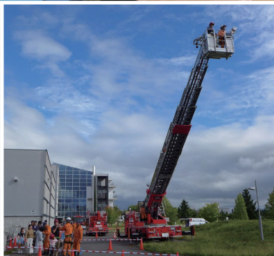
しゃ の はしご車に乗ってみよう！