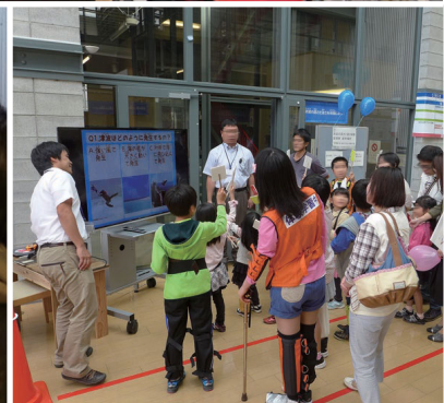
つなみ たか はや たいけん 津波の高さと速さを体験しよう！