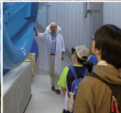
けんきゅうじょ たんけん 研究所を探検してみよう！