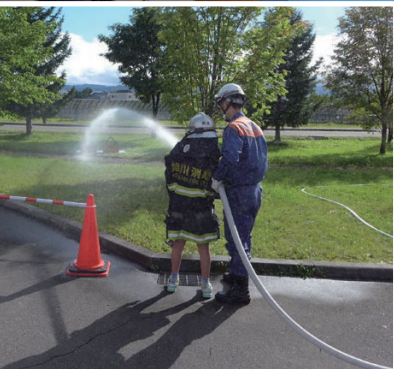
ひ け くんれん たいけん 火を消す訓練を体験しよう！