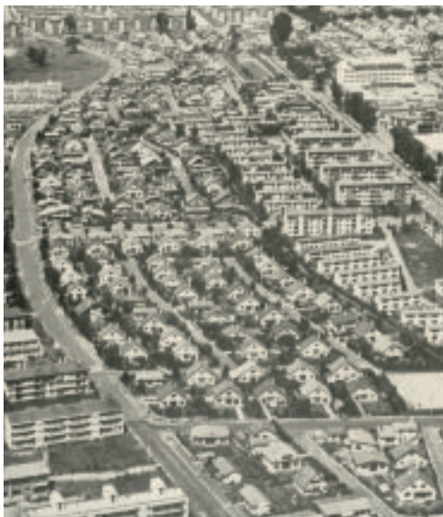
写真2 三角屋根CB造住宅団地

発し、1953年には「北海道防寒住宅建設等促進法(通称・寒住法)」が制定され、北海道の住まいのなかで最高傑作と言われている「三角屋根コンクリートブロック造住宅(三角屋根CB造住宅)」が開発されました(写真2)。