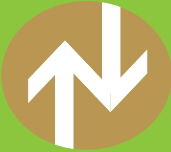
(一財)日本建築設備・昇降機センター制定

これは「昇降機等定期検査報告済証マーク」だよ。 指導センターを通して定期報告をしたエレベーターなどには、このマークがはってあるんだ。 金色の矢印のマークだよ。 マがしてみてね。