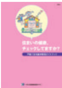
戸建て住宅維持管理 ガイドブック 「住まいの健康、 チェックしてますか？」

※リフォームや維持管理に関する資 料本を無料配布しています。 詳しくは、指導センターへお尋ね ください。