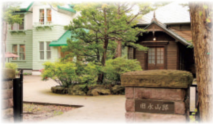
旧永山武四郎邸及び旧三菱鉱業寮