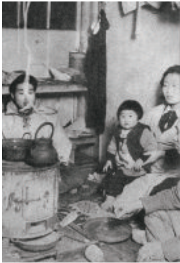
写真1 戦前期の生活の様子

ガラス窓や洋風の出窓などの洋風様式が導入されました。特にストーブの出現は、薪や石炭を燃やすことで寒さをしのぐことができ、「冬 ふゆ 季節、