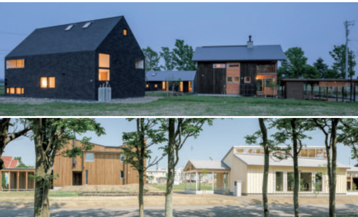
住宅展示場：南幌町みどり野きた住まいのヴィレッジ

※詳細は、「みんなで30年を考えようー北海道の生活と住まいー」(30年後の住まいを考える会、中西出版、2014年発行を参照ください)。