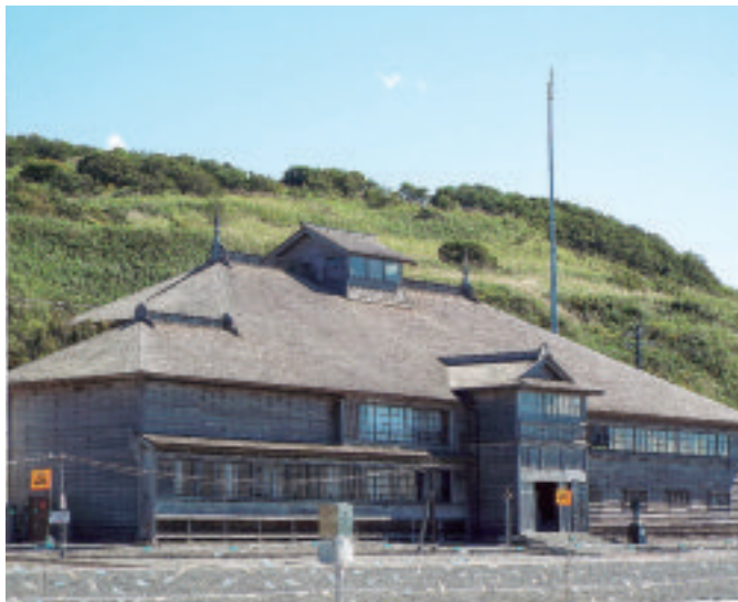
▲旧花田家番屋（留萌郡小平町）。1905（明治38）年ごろ、網元であった花田家によって建てられた2階建ての家屋。1971年に国の重要文化財に指定され、現在は一般公開されている。※3