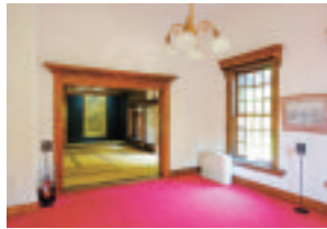
旧永山邸応接室と表座敷 ※2