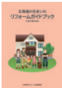
北海道の住まいの リフォームガイドブック